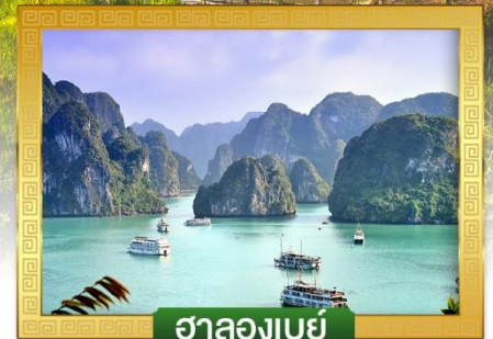
ฮาลองเบย์