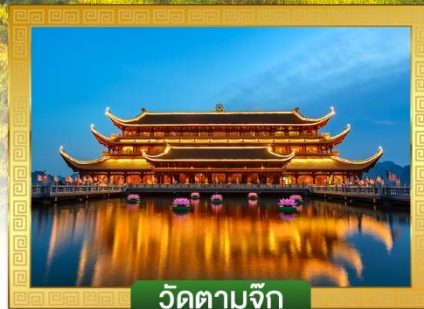
วัดตามจึก